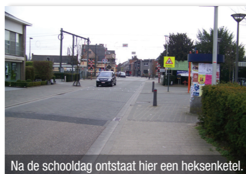
Na de schooldag ontstaat hier een heksenketel.

In afwachting van een definitieve oplossing zou een daadwerkelijke verkeersregeling van onze politie al heel wat soelaas kunnen bieden.