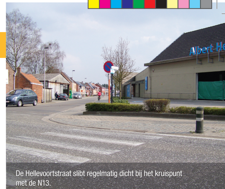
De Hellevoortstraat slijt regelmatig dicht bij het kruispunt met de N13.

Waarvan akte. Maar daarmee negeert de schepenen dus wel willens nillens het huishoudelijk reglement. Als een schepenen enkel maar hoeft te antwoorden als die 'er zin in heeft', riskeer je dat kritische vragen steeds nul op het rekest krijgen. Niet bepaald een toonbeeld van democratie. Laten we dus hopen dat het antwoord een verspreking van de betrokken schepenen is.