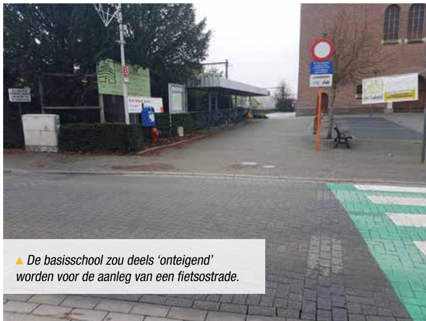
▲ De basisschool zou deels 'onteigend' worden voor de aanleg van een fietsostrate.

Wanneer we het gemeentebestuur daarover aan de tand voelden op de gemeenteraad van november, zei de burgemeester koudweg dat de school maar met een masterplan moest komen. Alsof de school vragende partij is voor een fietsostrate over z'n speelplaats. Het is aan het gemeentebestuur – dat zelf niet eens de moeite gedaan heeft om alternatieve routes te zoeken – om met een redelijk én betaalbaar plan te komen in plaats van onrealistische voorstellen te poneren.